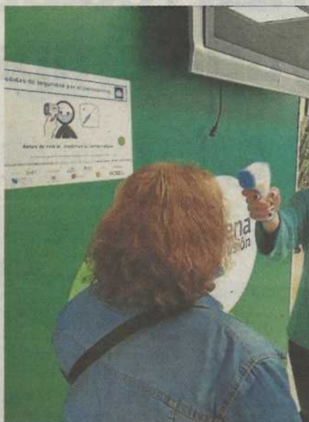
►► Un cartel avisa de que es obligatorio tomar la temperatura antes de entrar.

El próximo lunes acaba el estado de alarma, y los trabajadores vuelven a atender a las personas con discapacidad en