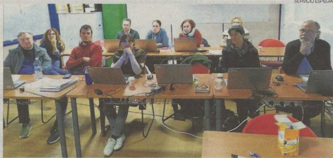
▶ Reunión sobre los ODS celebrada en Plena inclusión Aragón el pasado enero.

El personal técnico de la entidad va a recibir una formación sobre la Agenda 2030, que tuvo que ser aplazada por el estado de alarma